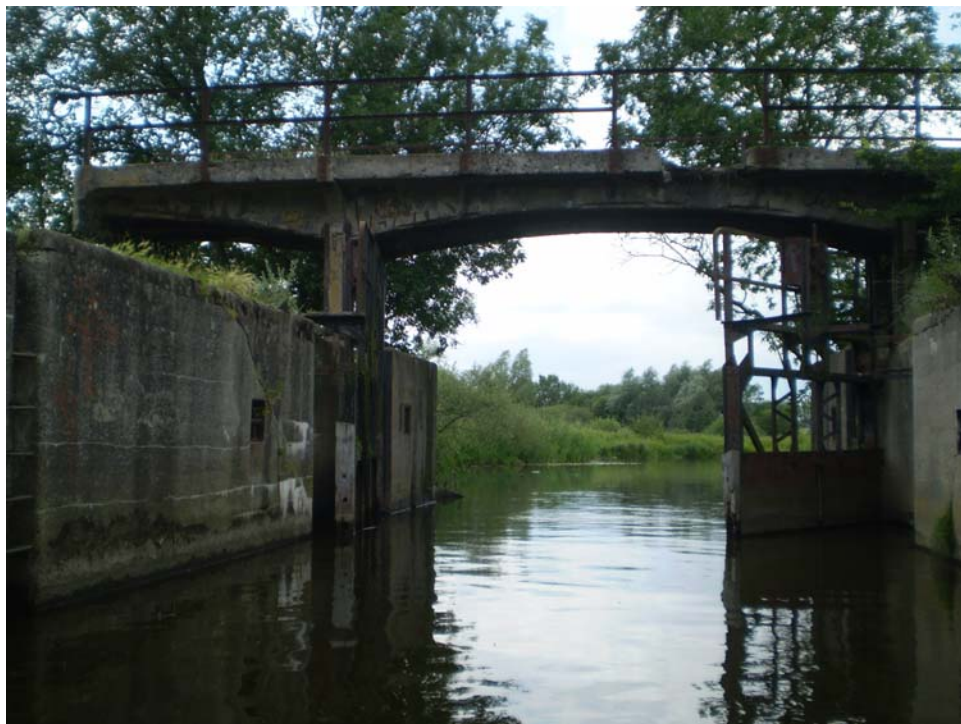
Jedna z uszkodzonych śluz znajdujących się na obszarze Międzyodrza

W okresie powojennym nastąpiła dewastacja terenu Międzyodrza, czemu sprzyjało jego położenie w strefie przygranicznej. W wyniku procesu doszło do: