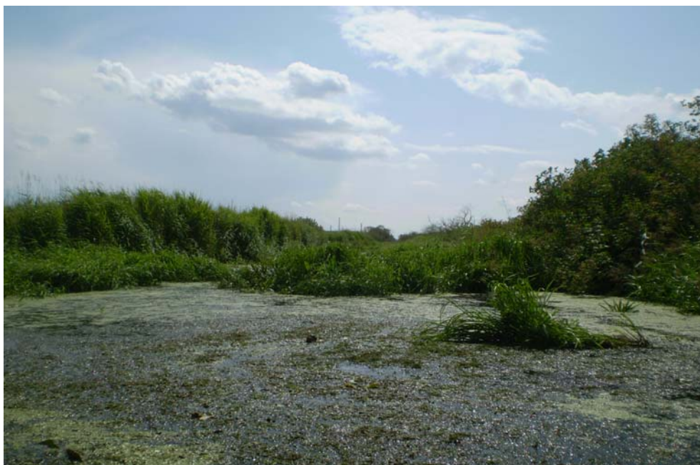
Zarastający kanał Międzyodrza

Międyodrze – obszar położony pomiędzy rzekami Odrą Wschodnią i Zachodnią. Na szczególny mikroklimat tej okolicy, wpływają wiejące tu wiatry, jak też stan Zalewu Szczecińskiego i Bałtyku powodujące nagłe i duże różnice poziomu wody i szybkości prądu. Na Międzyodrzu żyje około dwustu gatunków ptaków w tym orzeł bielik, myszołów i zimorodek. W kanałach zdarzają się ogromne żeremia bobrów. Ryby w Międzyodrzu reprezentują całą mnogość gatunkową, charakterystyczną dla naszych warunków geograficznych i klimatycznych. Łwione były w tych wodach rekordowe okazy sumów, karpia, leszczy, płoci, linów, okoni, miętusów, sandaczy, szczupaków i innych gatunków ryb. Niestety teren ten ulega degradacji na skutek braku ingerencji człowieka. Część kanałów uległa zamuleniu, wiele z nich jest zarośnięta, co w przyszłości może spowodować zanik szlachetnych gatunków zwierząt.